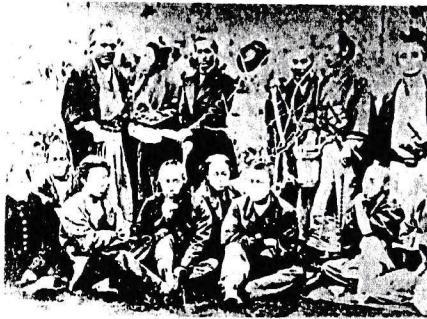
松下村塾 塾生たち

「結婚とはスタート」とよく耳にします。結婚は「天という名の磁石」「春という名の磁石」「子どもという名の磁石」を今に入れたということと似たこともあります。そして磁石という存在が自分を磨いてくれているのでしょ。私の磁石は今年で20年経ちました。紆余曲折しながら今も互いに磨きあっています…… ☺